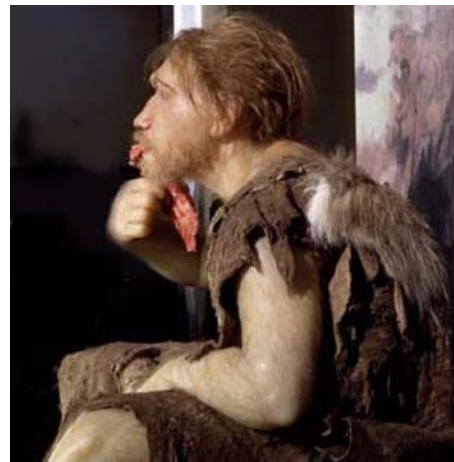
Abb. 13: Rekonstruktion eines Neandertalers.

ein interessanter Beleg für die Out-of-Africa-Hypothese. Weiters ergab sich, dass die Entstehung der Kleiderlaus etwa 72.000 ( \pm 42.000 ) Jahre zurückliegt. 4 Daraus lässt sich schließen, dass die Kleidung nicht viel früher entwickelt wurde, vielleicht vor ca. 110.000 Jahren. Diese Zeit scheint überraschend kurz – lebten Menschen doch schon früher in kühlen Klimaten – deckt sich aber mit den paläontologischen Daten über die Einwanderung von Homo sapiens in Europa. 5 Ob nun H. sapiens oder H. neanderthalensis das Patent zusteht, bleibt Stoff für Spekulation.