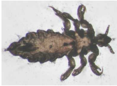
Abb. 12: Die Menschenlaus Pediculus humanus erlaubt Schlüsse über den Ursprung der Kleidung

Doch die umgekehrte Folgerung ist für die gegenwärtige Überlegung bei weitem interessanter: Wenn man den Prozess der Artbildung bei Kopf- und Kleiderlaus anhand genetischer Marker rückverfolgt, lässt sich (wenn auch mit recht großer Unsicherheit) der Zeitpunkt bestimmen, an dem die Trennung der beiden Sippen begann. Herangezogen wurde mitochondriale (und andere) DNA von Menschenläusen aus mehreren Ländern der Erde, zwecks Kalibrierung der „genetischen Uhr“ wurde auch DNA von Schimpansenläusen ( Pediculus schaeffi ) untersucht. Dabei zeigte sich einerseits, dass die genetische Diversität der Läuse (so wie die der Menschen) in Afrika am höchsten ist –